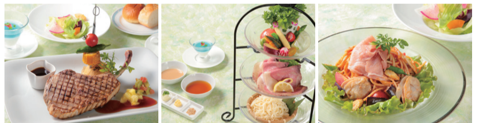
房総ポーク骨付きロースのグリル 2,750円税込 チバザビーフの冷製サラダ仕立て 2,750円税込 九十九里産蛤と夏野菜の冷製パスタ 2,200円税込